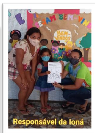
Responsável da Ioná