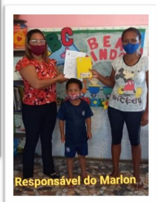
Responsável do Marlon